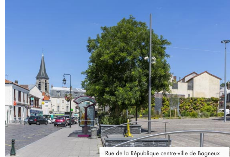
Rue de la République centre-ville de Bagneux

À seulement 3 km* de la Porte d'Orléans, la ville de Bagneux est pleine d'atouts. Vivante, commerçante et dynamique, elle prépare son entrée très attendue dans le Grand Paris. Forte de 1 831 entreprises installées sur son territoire, Bagneux affiche une forte vitalité économique.**