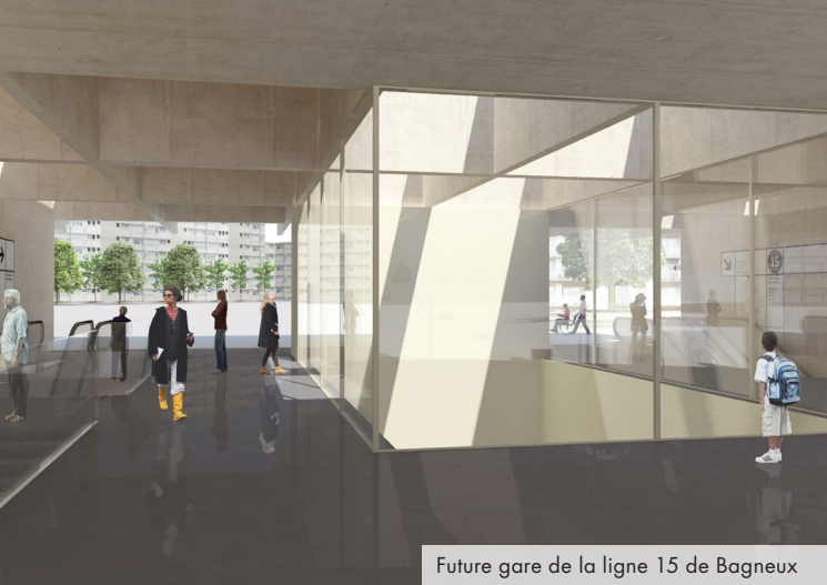
Future gare de la ligne 15 de Bagneux