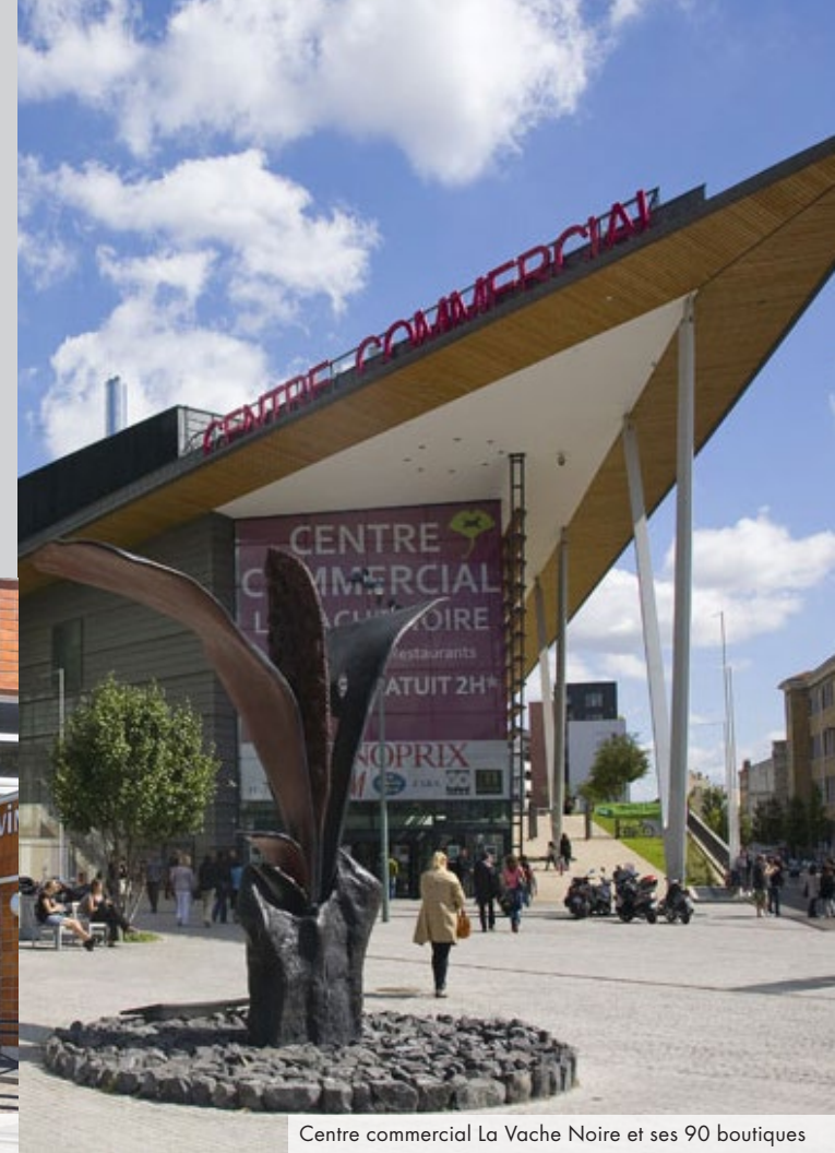
Centre commercial La Vache Noire et ses 90 boutiques