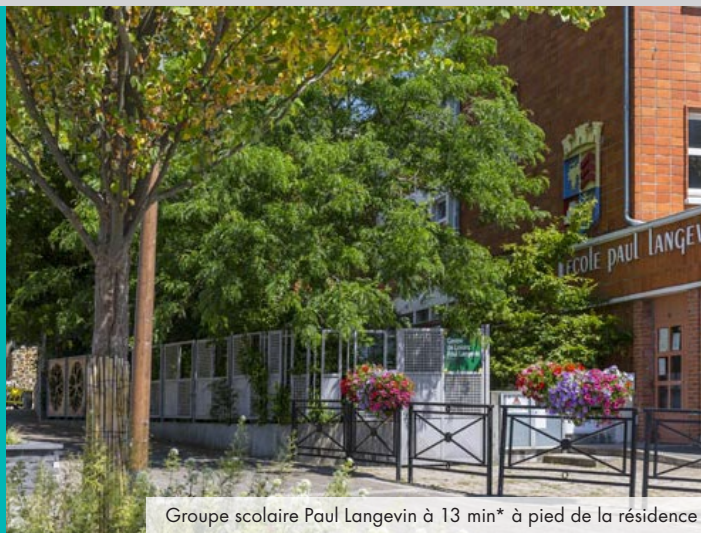
Groupe scolaire Paul Langevin à 13 min* à pied de la résidence